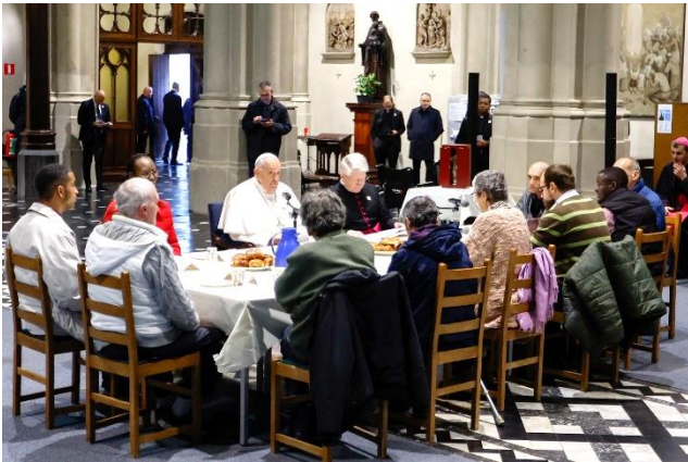
Paus Franciscus ontbijt met een groep daklozen en migranten in Brussel.

Het is alom bekend dat we te maken hebben met een pastorale paus en zo heeft hij dit laten blijken bij dit bezoek. Ook is het een man van verrassingen. Naast een aantal officiële plichtplegingen dook hij steeds op bij mensen die hem echt nodig hadden. Zoals het bezoek aan de daklozen en de jongeren op zaterdagavond.